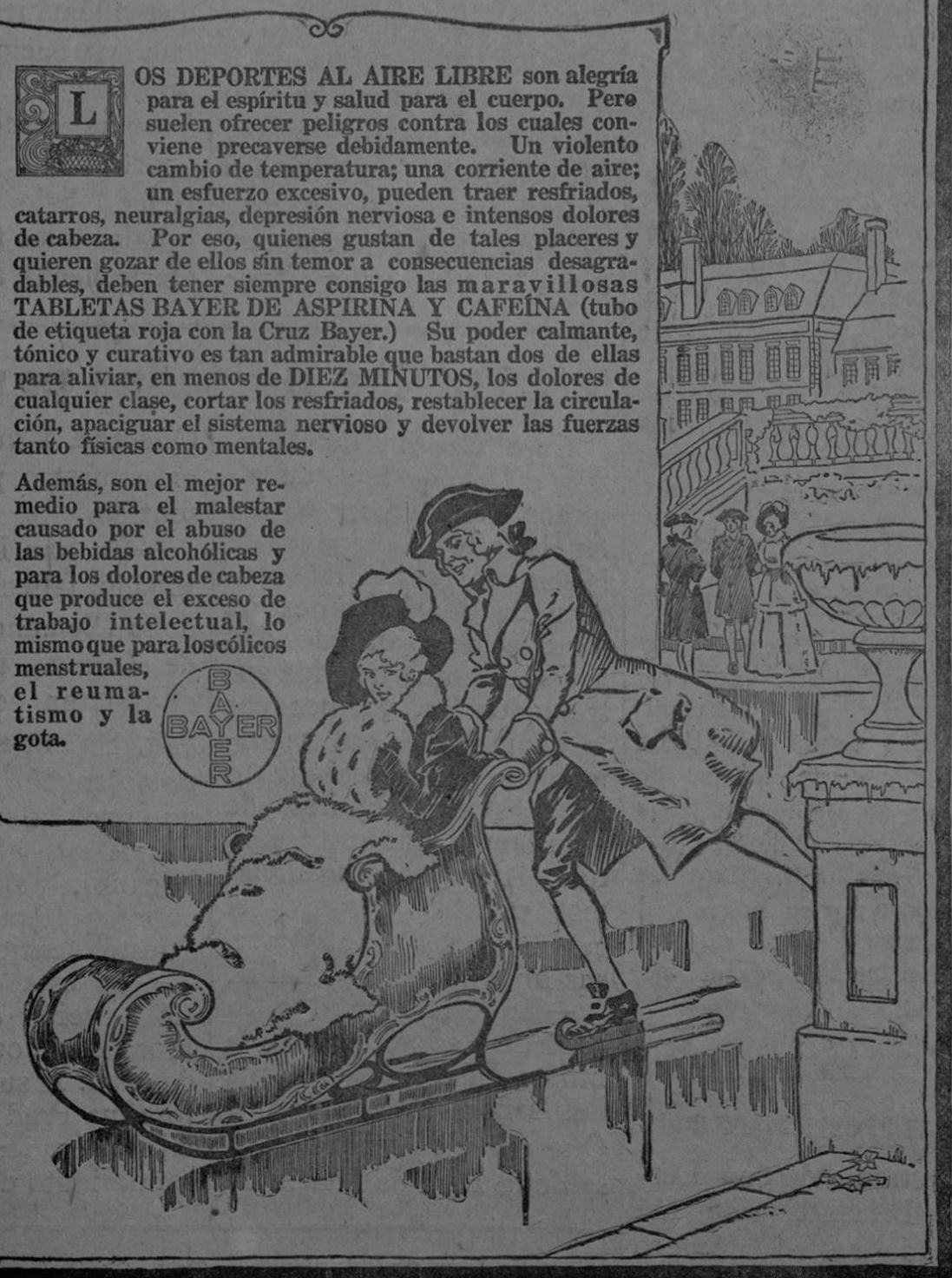
AGENTES: THE COSTA RICA MERCANTILE CO.